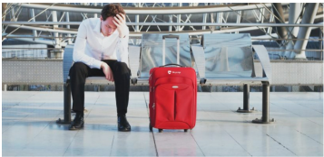
Czy mistrzom świata w siatkówce przysługuje odszkodowanie za opóźniony lot?