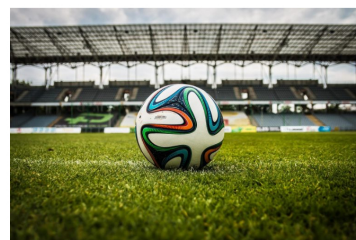
Sponsoring – podstawowy instrument marketingu sportowego