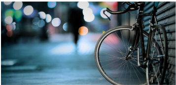
Dlaczego warto uprawiać turystykę rowerową?