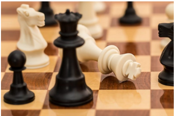
Gra w szachy