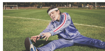
Aktywność fizyczna latem, a dieta