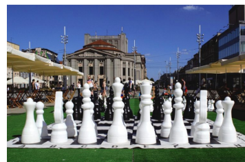
Gra miejska, czyli co robić w wolnym czasie