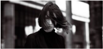
Jak wybrać kurtkę na wietrzne i deszczowe dni treningowe?